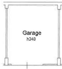
PIANO 1° SOTTOSTRADA